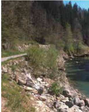
9.870 Meter Geh- und Radweg mit wenig Höhenunterschied

Das beeindruckende Tal der Bregenzerach – für Generationen war es eine der wichtigsten Verkehrsverbindungen. Jetzt hat die Wälderbahn-Trasse mit dem Achtalweg eine neue, erfüllende Aufgabe: Den Menschen in der Region Raum für Regeneration und Erholung zu geben – in einem ganz besonderen, wertvollen Umfeld.