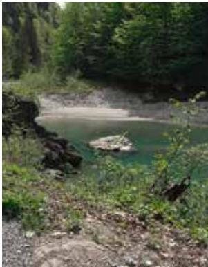
... und im Großen.