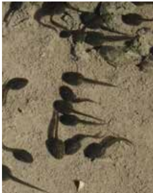
Natur erleben im Kleinen ...