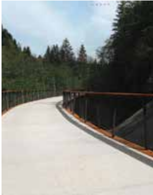
Kulturhistorisch wertvolle Bauwerke der Wälderbahn neu genutzt